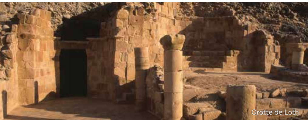
Grotte de Loth