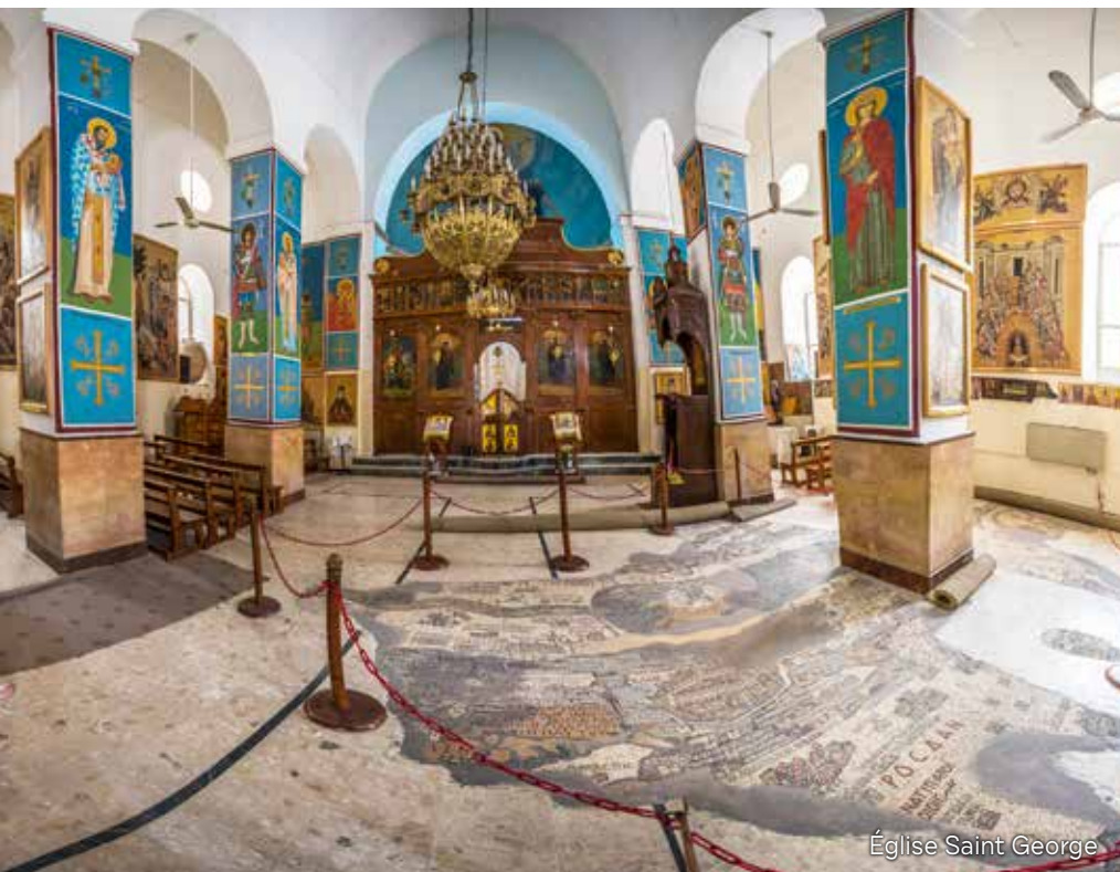
Église Saint George

Mais le vrai trésor de Madaba est situé dans l'église orthodoxe de Saint George. C'est une carte en mosaïques de Jérusalem et de la Terre Sainte datant du VI ème siècle après J.C. - la première carte de la Terre Sainte à avoir survécu depuis l'antiquité. C'est pourquoi Madaba est surnommée « la cité des mosaïques ».