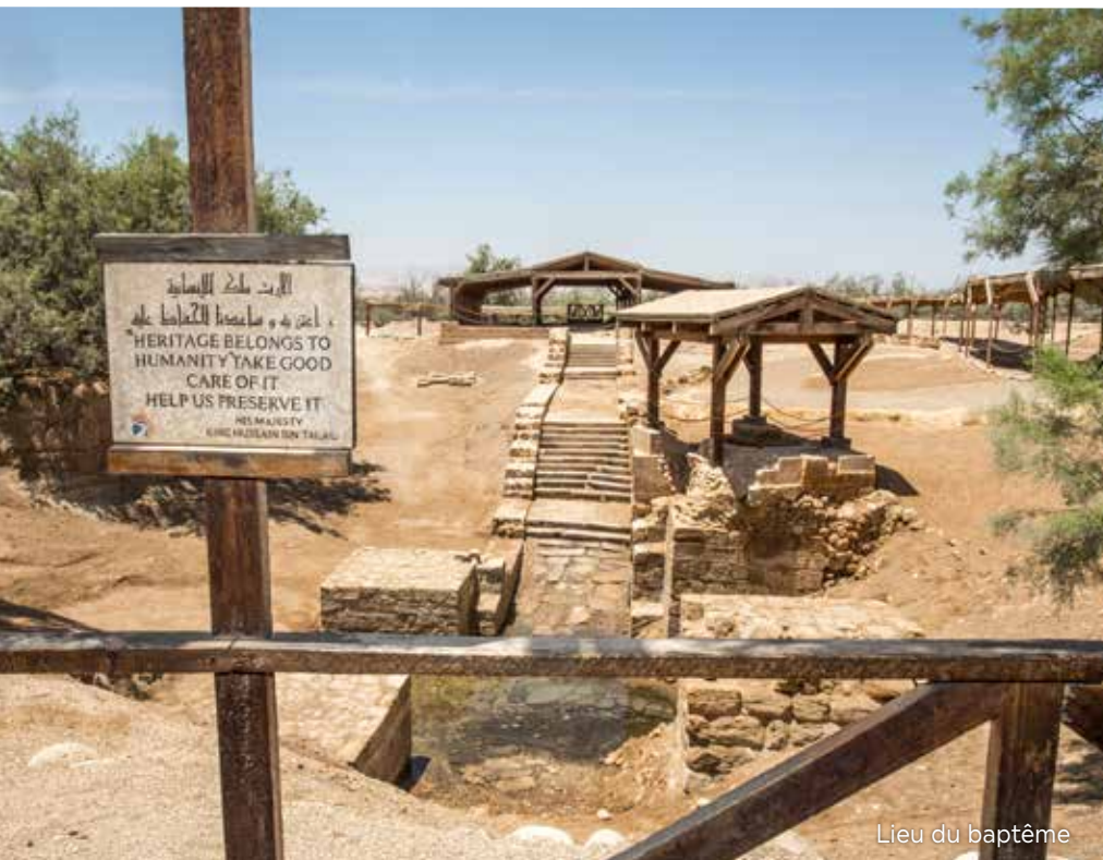
Lieu du baptême

L'histoire de la Jordanie est vraiment impressionnante. C'est aussi là que Jacob a lutté contre l'Ange de Dieu, que la femme de Loth fut changée en statue de sel, que Job a été mis à l'épreuve et récompensé pour sa foi, et qu'Élie s'est élevé au Paradis. C'est aussi par-là que Moïse a guidé les Israélites lors de leur fuite d'Égypte, là où il a révélé la Loi de Dieu, là où Jésus fut baptisé, là où les premiers disciples furent rassemblés, et là où la Sainte Trinité (le Père, le Fils et le Saint Esprit) s'est manifestée.