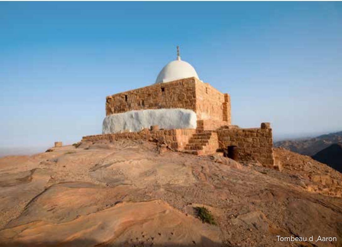
Tombeau d ,Aaron

Le Royaume Hachémite de la Jordanie a été un refuge pour plusieurs figures bibliques de l'histoire : Abraham, Job, Moïse, Ruth, Élie, Jean le Baptiste, Jésus-Christ et Paul, pour n'en citer que quelques-unes. La Jordanie est la seule région de la Terre Sainte à avoir été visitée par tous ces importants personnages, et est ainsi étroitement liée aux récits de la Sainte Bible.