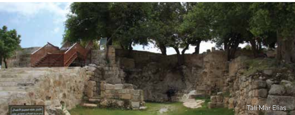
Tall Mar Elias