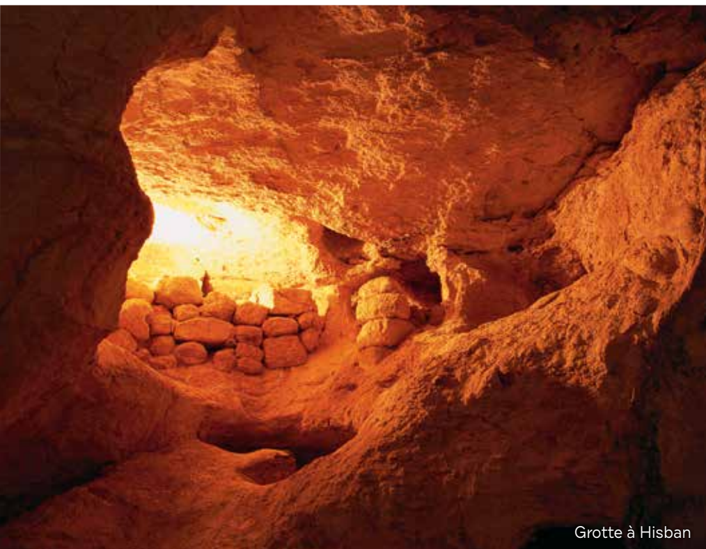
Grotte à Hisban