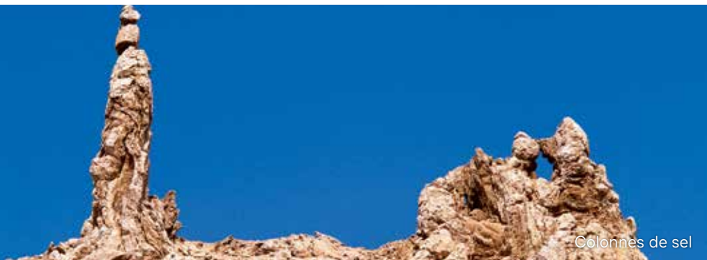
Colonnes de sel

Abraham et Loth ont probablement vécu au début ou au milieu de l'âge de bronze (2 500 – 1 500 avant J.C.). Bien que ceci n'ait pas été confirmé, les ruines des anciennes villes fortifiées de Bab ed-Dhra' et Numeira, au sud-est des plaines centrales de la Mer Morte, correspondraient aux cités de Sodome et Gomorrhe. Ces deux sites ont probablement été détruits par un incendie au début de l'âge de bronze, après quoi ils sont restés inhabités. Les trois autres villes de la plaine étaient « Adama, Seboïm et Béla (Tsoar) » (Genèse 14:2). Leurs ruines sont toujours enterrées, quelque part près de la Mer Morte.