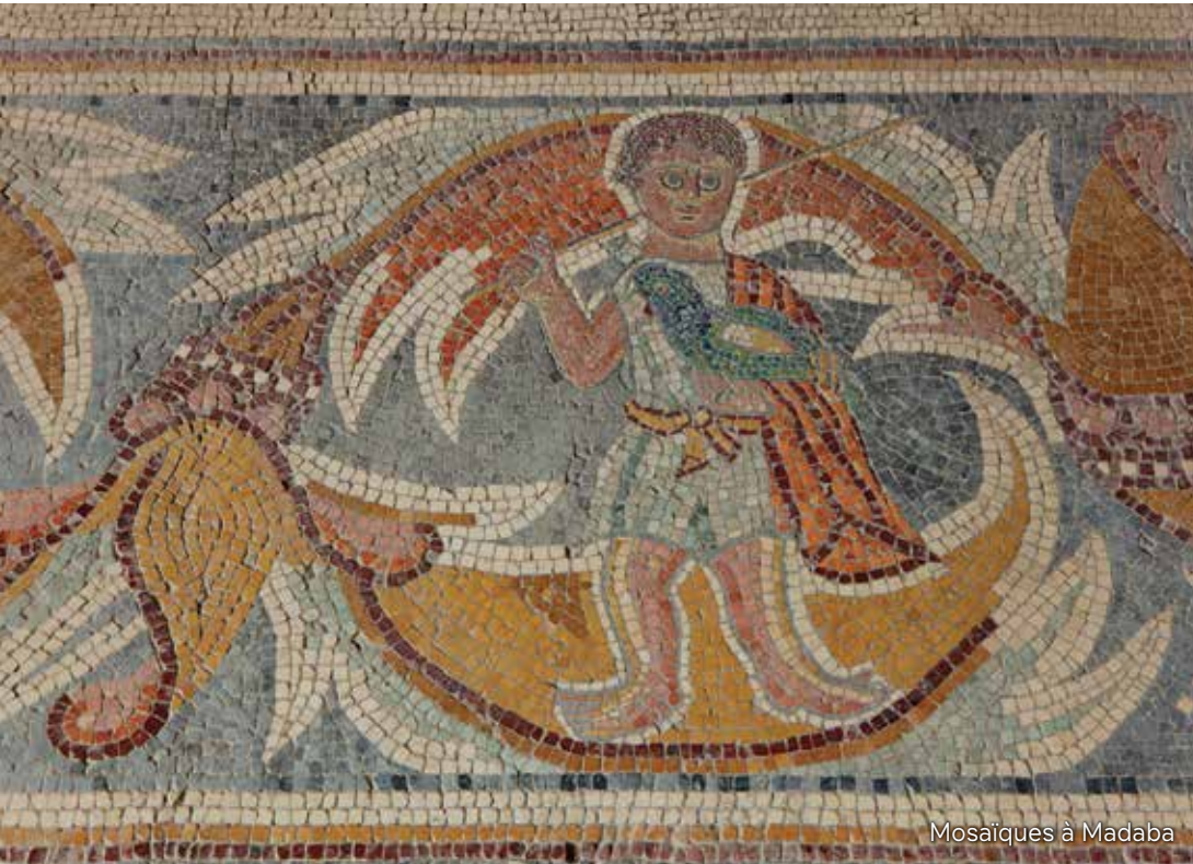
Mosaïques à Madaba

Appelé Medeba dans l'Ancien Testament, Madaba et son arrière-pays sont situés dans le centre de la Jordanie. Cette région est évoquée dans les récits de Moïse et son Exode, la guerre de David contre les Moabites, la prophétie d'Isaïah contre le Moab, et la révolte du Roi Meshah de Moab contre Israël.