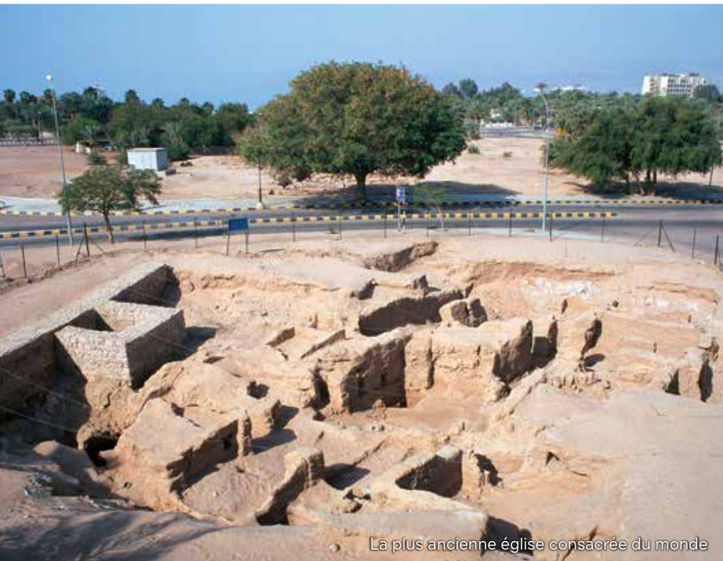
La plus ancienne église consacrée du monde