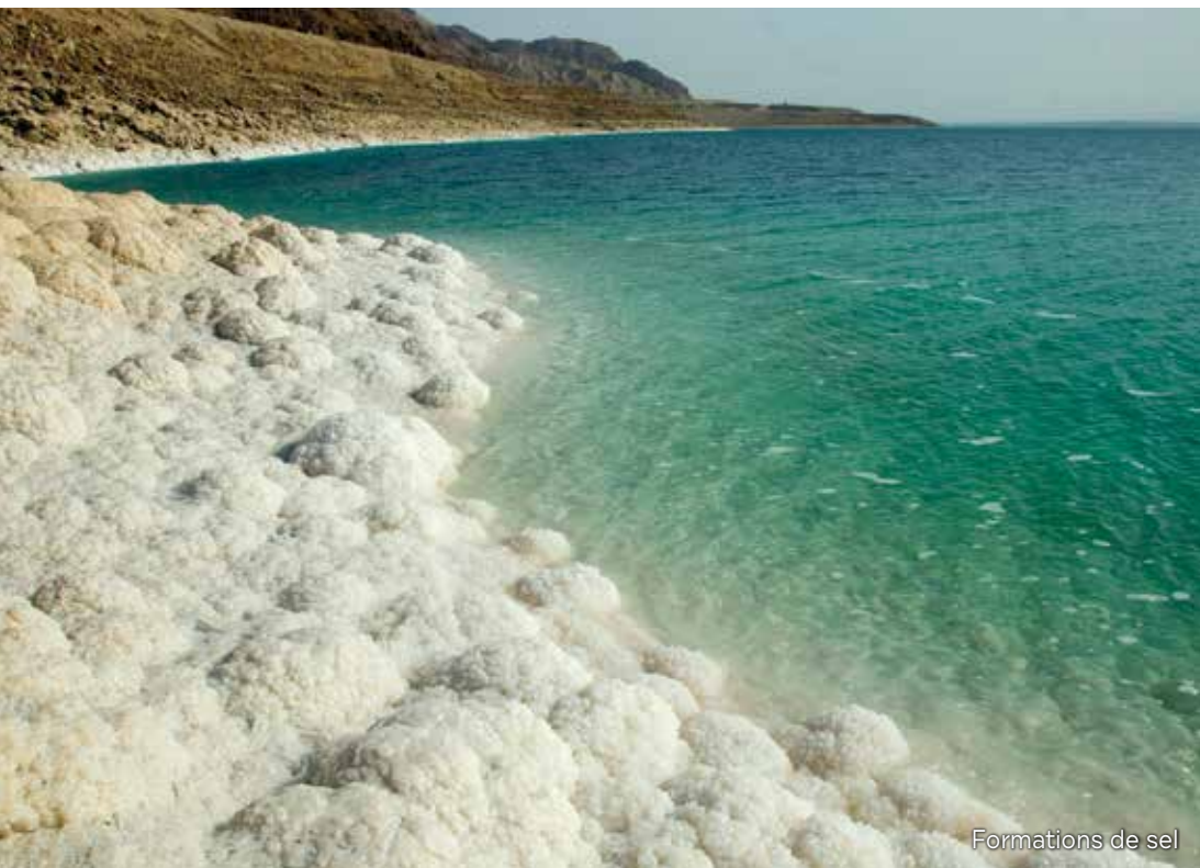
Formations de sel