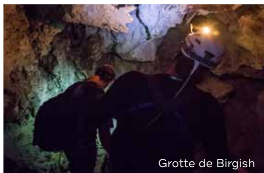
Grotte de Birgish

Cette région consiste, essentiellement, en des fermes, des bois de chênes, des champs d'oliviers et des zones de roche calcaire. De la frontière nord de la Jordanie jusqu'au sud d'Amman, la région présente un paysage de type méditerranéen, tandis que celle à l'ouest de la Vallée du Jourdain constitue un environnement semi-tropical. Cette variation crée un contraste de biosphères distantes l'une de l'autre d'à peine 20 minutes de route. En ayant tout cela à l'esprit, voici quelques-unes des activités que vous aurez le plaisir de pratiquer dans cette nature.