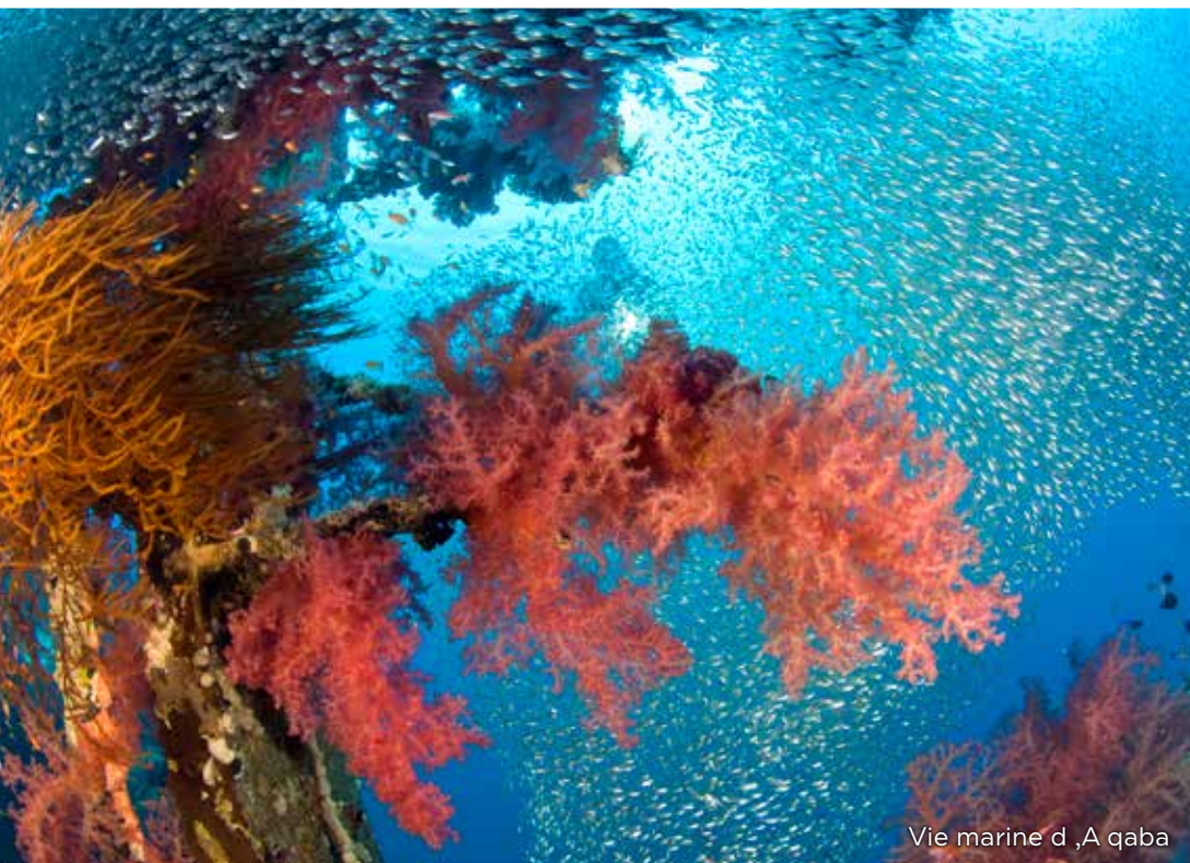
Vie marine d'Aqaba