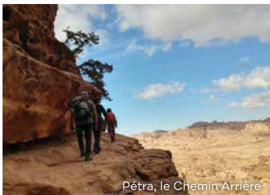
Pétra, le Chemin Arrière

Pétra, Wadi Rum et Aqaba, sont également connus comme le triangle d'or de la Jordanie. Vous pourrez vous y promener sur les traces des civilisations anciennes, plonger dans les eaux tièdes de la Mer Rouge, ou découvrir le paysage désertique de Wadi Rum et qui ressemble à celui de la planète Mars.