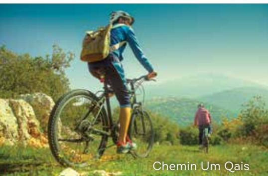
Chemin Um Qais