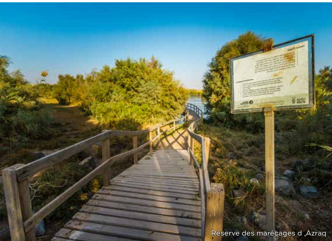
Réserve des marécages d'Azraq

Azraq est une oasis de marécages unique, située au cœur du désert semi-aride de la Jordanie. La réserve, gérée par la RSCN, est un lieu idéal pour observer les oiseaux, en particulier au cours de la saison des migrations, lorsque de nombreuses espèces d'oiseaux s'y arrêtent pour se reposer pendant leur éprouvant voyage entre l'Europe et l'Afrique. Certains oiseaux y restent l'hiver ou se reproduisent au sein de la zone protégée des marécages.