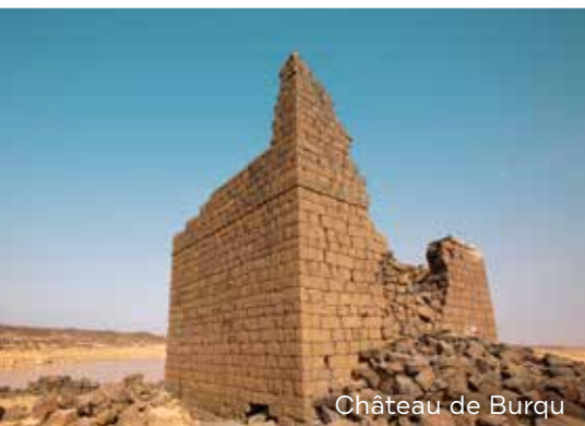
Château de Burqu