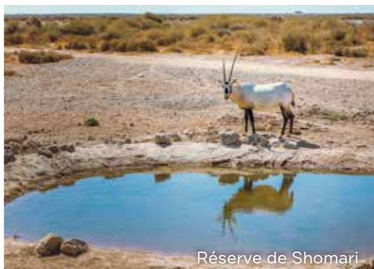
Réserve de Shomari