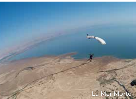
La Mer Morte