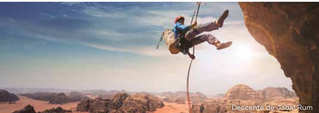
Descente de Jabal Rum