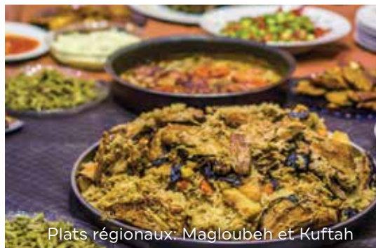
Plats régionaux: Magloubeh et Kuffah