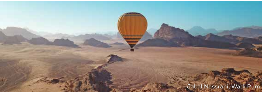
Jabal Nassrani, Wadi Rum