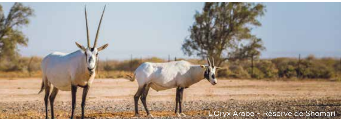
L'Oryx Arabe - Réserve de Shomari