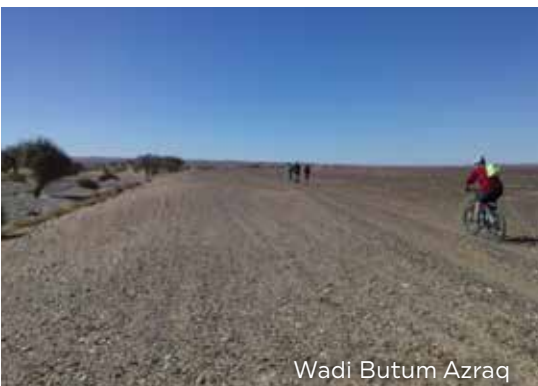
Wadi Butum Azraq