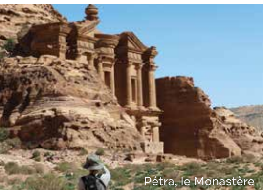
Pétra, le Monastère