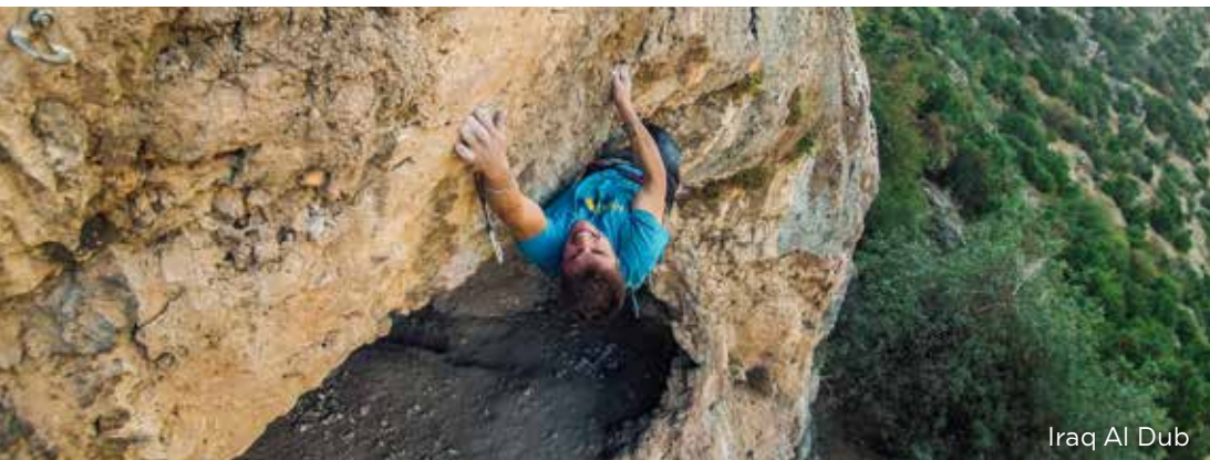
Iraq Al Dub