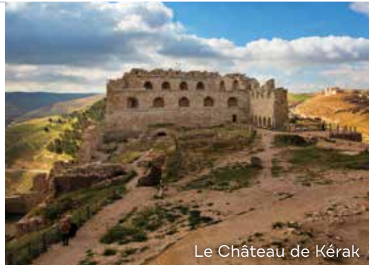
Le Château de Kérak