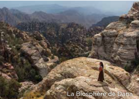
La Biosphère de Dana