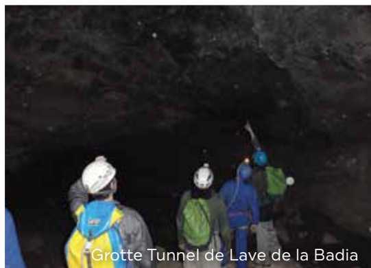
Grotte Tunnel de Lave de la Badia

Dans les temps anciens, un volcan à présent inactif, près de la frontière sud de la Syrie, est entré en éruption et a recouvert notre région est d'une couverture de roches volcaniques. De nombreux lacs se trouvent dans cette zone. On y trouve même, en son centre, une oasis qui autrefois était de la taille de Manhattan. De nombreux animaux exotiques ont fait de ce paysage unique leur habitat.