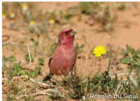
Roselin du Sinaï