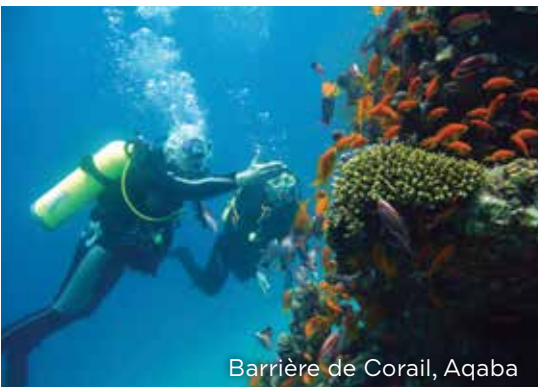
Barrière de Corail, Aqaba