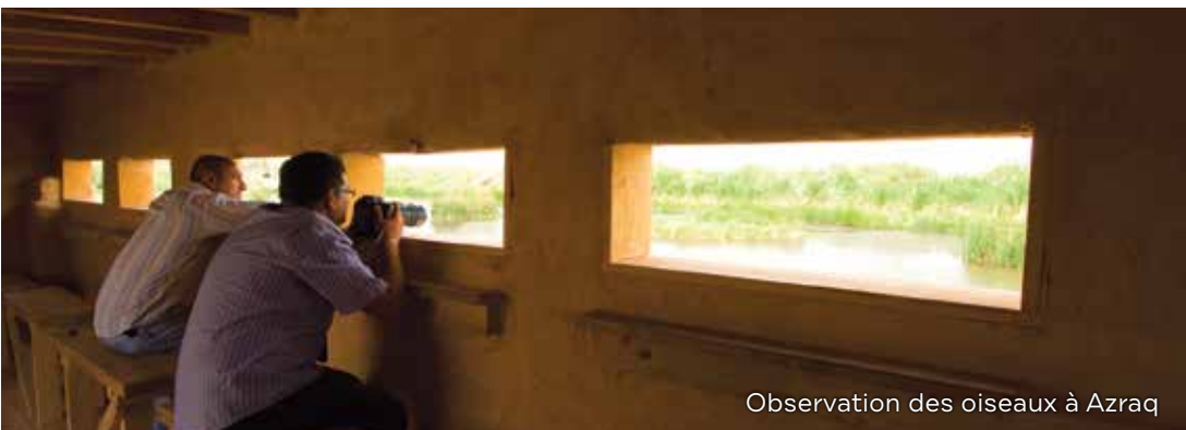
Observation des oiseaux à Azraq

La Jordanie est une destination idéale pour les amateurs d'oiseaux. La remarquable variété des habitats, des montagnes escarpées et des forêts verdoyantes aux steppes touffues et déserts arides, fournit un environnement idéal pour de nombreuses espèces d'oiseaux sauvages. De plus, sa situation au carrefour de l'Europe, l'Asie et l'Afrique, fait que les oiseaux migrateurs de ces trois continents peuvent parfois être vus ensemble dans la même région.